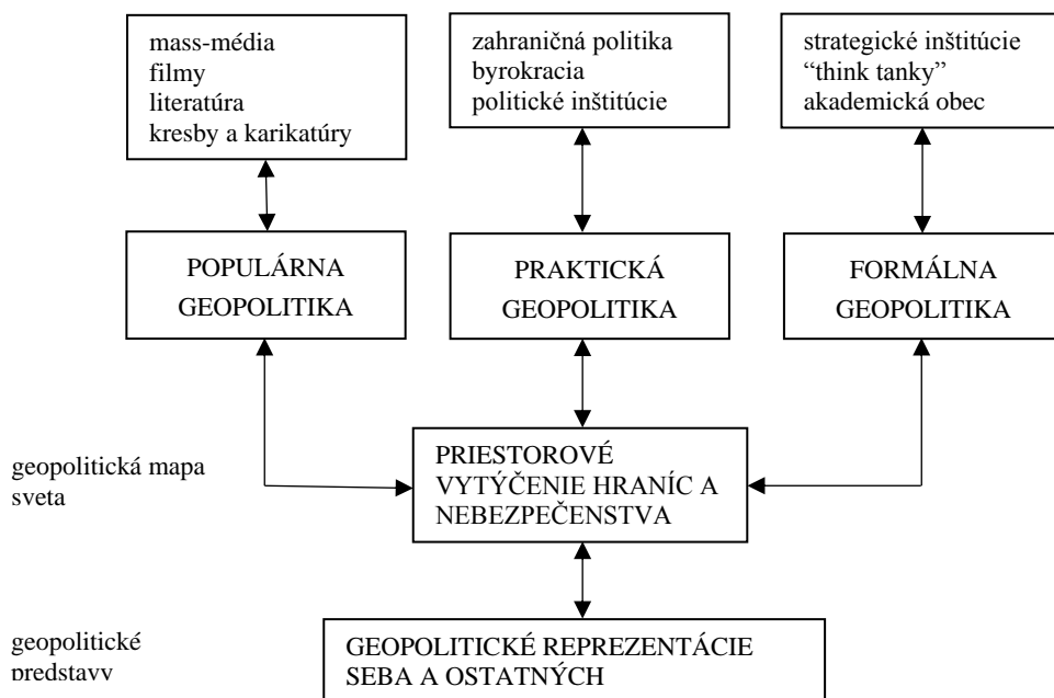
Obr. 2. Delenie geopolitiky

kontext skúmaných geopolitických modelov (Sharp 2000, p. 333). Táto geopolitická sústava má v chápaní KG tri hlavné typologické podmnožiny v podobe praktickej, formálnej a populárnej geopolitiky. Táto geopolitická sústava má v chápaní KG tri hlavné typologické podmnožiny v podobe praktickej, formálnej a populárnej geopolitiky (obr. 2).