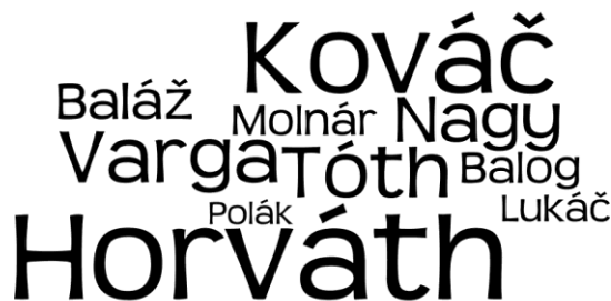
Obr. 1. Najčastejšie priezviská v SR v roku 2013 vo forme wordle; zostavila autorka podľa vzoru Longley et al. (2011)

Podľa informácií Ministerstva vnútra SR bolo v roku 2013 najčastejším priezviskom na Slovensku priezvisko Horváth/Horváthová. Toto priezvisko malo 17 691 mužov a 17 551 žien (spolu 35 242). Charakteristické je prevažne v okresoch Bratislava, Trnava, Nové Zámky, Dunajská Streda, Komárno a Rimavská Sobota. Druhým najčastejším priezviskom je Kováč/Kováčová s 29 892 nositeľmi. V poradí tretím najčastejším priezviskom je Varga/Vargová s 21 389 nositeľmi. Desiatku najfrekvencovanejších priezvisk na Slovensku zobrazuje „wordle – mračno slov“ (obr. 1) ako špecifická forma kartografického zobrazenia, v ktorom veľkosť písma zodpovedá absolútnemu počtu nositeľov daného priezviska.