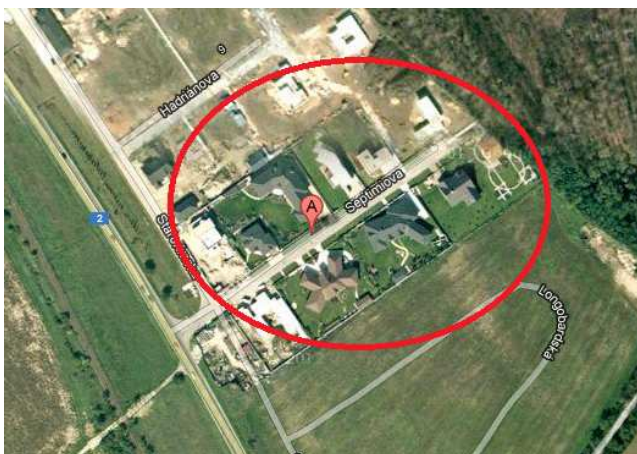
Obr. 6. Pohľad na Septimiovu ulicu

Ďalšou lokalitou s charakterom gated community je Septimiova ulica v Rusovciach, ktorá na rozdiel od Strmých vrškov vznikla iba nedávno a stále je v procese budovania. Táto ulica sa nachádza na úplnej periférii mestskej časti Rusovce a jedná sa o novú rezidenčnú výstavbu. Ulica je tvorená rodinnými domami, ktoré sú architektonicky odlišné (Obr. 6). Vstup do ulice je blokovaný charakteristickou bránou, jedná sa o slepú ulicu. Domy v ulici nie sú typické honosné vilové domy, skôr ide zástavbu jednoduchších rodinných domov. Na túto rezidenčnú výstavbu pravdepodobne nadviaže ďalšia, keďže v susedstve sa nachádza nová ulica, ktorá už je pomenovaná, no výstavba zatiaľ zahájená nebola.