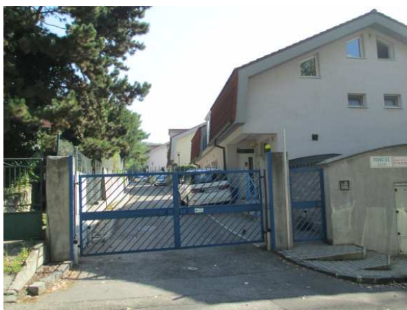
Obr. 3. Pohľad na Perneckú ulicu

Popri výstavbe uzavretých komunít developermi za účelom ďalšieho predaja súkromným osobám možno v prostredí Bratislavy identifikovať viacero lokalít, ktoré boli ohradené samotnými rezidentmi. Jednou z takýchto lokalít je Pernecká ulica v Karlovej Vsi. Celá ulica je tvorená dvanástimi rodinnými domami, ktoré sú od okolitého priestoru oddelené elektrickou bránou a chránené videovrátnikom (obr. 3). Táto lokalita poskytuje veľmi komfortné bývanie pre ekonomicky silné obyvateľstvo. Tento fakt potvrdzuje charakter zástavby (veľké vilové domy), typy automobilov parkujúcich za bránou ulice (finančne náročnejšie značky). Súkromná ulica je situovaná v atraktívnom prírodnom prostredí v blízkosti Líščieho údolia na okraji bytovej zástavby, ale zároveň vo vnútornom meste, v oblasti s veľmi dobrou občianskou vybavenosťou.