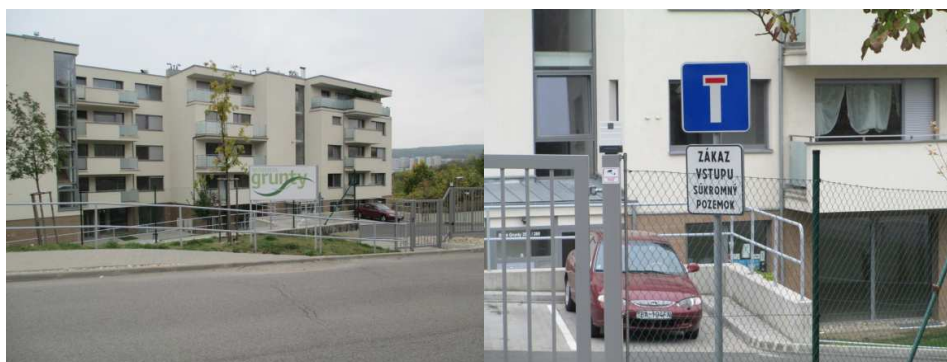
Obr. 1, 2. Pohľad na Rezidenciu Grunty

Rezidencia Grunty predstavujú stavbu financovanú developerom. Jej súčasťou sú štyri bytové domy a päť mestských víl s terasovite ustupujúcou dispozíciou, v ktorých je spolu 105 bytov a 166 garážových miest, k dispozícii sú aj kancelárske priestory. Investor pri propagácii svojich stavieb disponuje viacerými skvelými lákadlami. Jedná sa o prestížne bývanie, uzatvorené, chránené kondomínium s vybudovaným detským ihriskom a sadovými úpravami, ktoré vytvára priestor pre nadštandardné možnosti bývania. Vyzdvihuje sa možnosť súkromia v širšom centre hlavného mesta, množstvo výnimočných miest na relax, oddych a zábavu v blízkej ZOO, botanickej záhrade a pod. Výhodou tejto novej obytnej lokality má tiež byť dobrá dostupnosť MHD, možnosť rýchleho napojenia sa autom na hlavné mestské komunikácie a diaľnicu D1 a kompletne vybudovaná občianska vybavenosť v blízkom okolí. Celá lokalita je ohradená a uzavretá bránou umožňujúcou vstup len pre rezidentov (obr. 1 a 2) a predstavuje typický príklad uzavretého spoločenstva vo vnútornom meste.