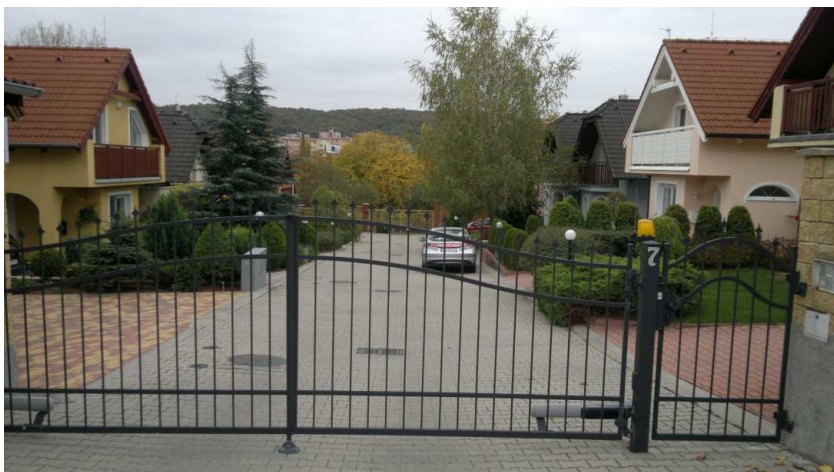
Obr. 4. Uzavretá komunita v Lamači

Lokalita s podobným charakterom sa nachádza v mestskej časti Lamač. Jedná sa o niekoľko architektonicky totožných rodinných domov na jednej ulici. Domy sú ohradené a vstup do ulice je zamedzený bránou. V tomto prípade nejde o honosné vilové domy, ide o klasickú zástavbu rodinných domov, ktorá je ale uzavretá pred nerezidentmi a zabezpečuje bezpečnosť a súkromie pre svojich obyvateľov (obr. 4).