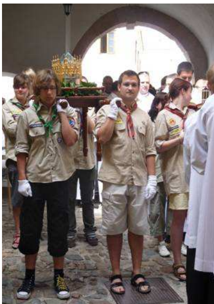
Obr. 1. Predmet kultu-relikvie sv. Konštantína

Nitriansky hrad, resp. areál , postavený na sivých, piesčitých vápencoch (Mišík, Vlčko, 1997) je cieľom pútnikov od roku 2006, kedy bolo dejisko púte premiestnené z Kalvárie. Predmetom kultu sú relikvie vierozvestcov sv. Konštantína a Metoda (obr. č. 1).