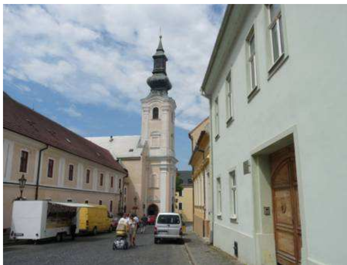
Obr. 3. Ambulantné predajne počas púte v Nitre

Na hranici sakrálneho priestoru boli pre pútnikov vytvorené zóny pre občerstvenie, mobilného charakteru, rovnako ako aj sociálne zariadenia. Mimo sakrálneho priestoru boli vytvorené možnosti pre stánovanie pútnikov a taktiež ambulatný predaj suvenírov a sladkostí (obr. č. 3).