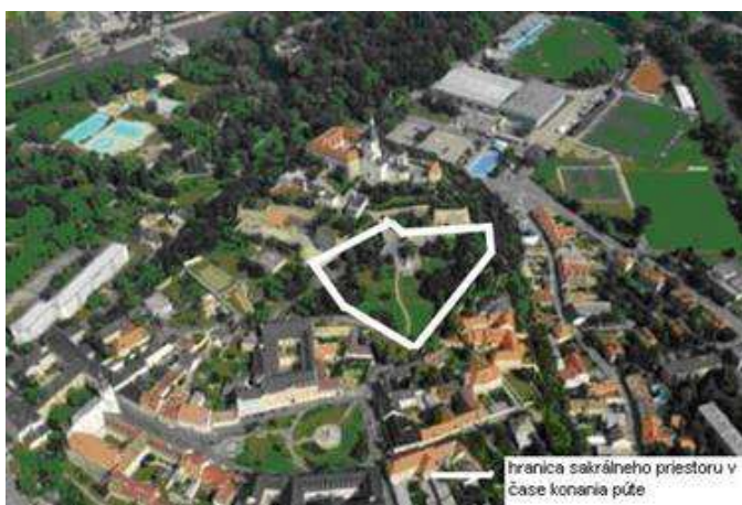
Obr. 2. Pútnický areál v Nitre

Pútnický areál sa nachádza v bezprostrednej blízkosti hradu s katedrálou sv. Emeráma. Tá pozostáva z historicky i architektonicky troch rozdielnych kostolov; Dolný kostol (18. stor.), Horný kostol (17. stor.) a románsky kostolík (11. stor.). Práve v románskom kostole z 11. stor. sú uložené okrem relikvií sv. Svorada a sv. Beňadika aj relikvie sv. Cyrila, ktoré sú darom pápeža Pavla VI. z roku 1969 (1100. výročie smrti sv. Cyrila-Konštantína). Samotný vnútorný areál hradu však nie je priamo v čase púte hlavným cieľom prichádzajúcich, navyše aj priestory Diecézneho múzea boli v čase púte neprístupné.