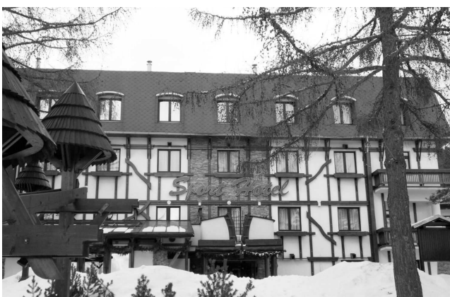
Obr. 3 – 4. Pôvodný hotel Šport v roku 1978 a jeho rekonštrukcia z roku 2009