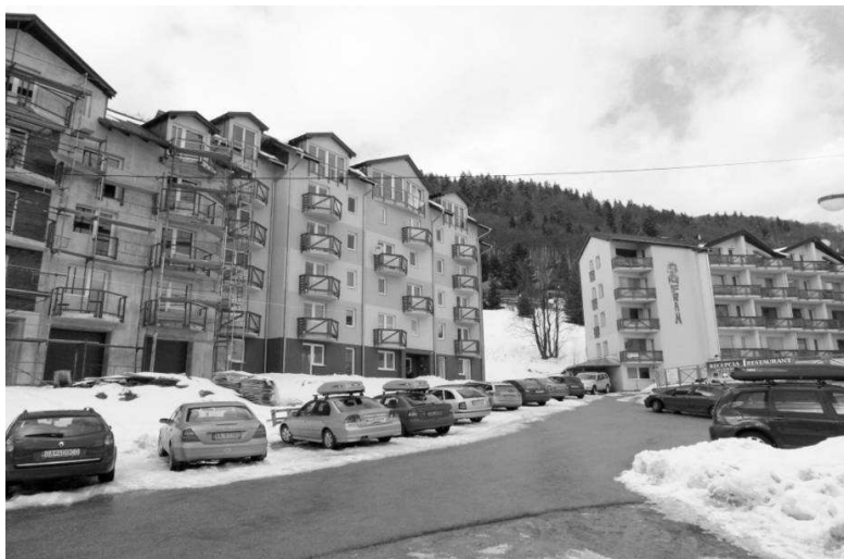
Obr. 1. Apartamentové domy – Mišúty v stredisku Donovaly

Bližšie k Butlerovej predstave rekreačnej urbanizácie má Conzenov bádateľský model štruktúry mesta (Matlovič 1998). Totiž aj v predstave napríklad malých škandinávskych mestečiek, alebo v koncepcii formálneho statusu mesta – ako je to napríklad na Slovensku v prípade kúpeľných miest, vystupuje mestotvorná funkcia v „pocite mesta“ – ktorý zhmotňujú mestské morfoštruktúry alebo priamo rekreačná funkcia – napríklad kúpeľníctvo.