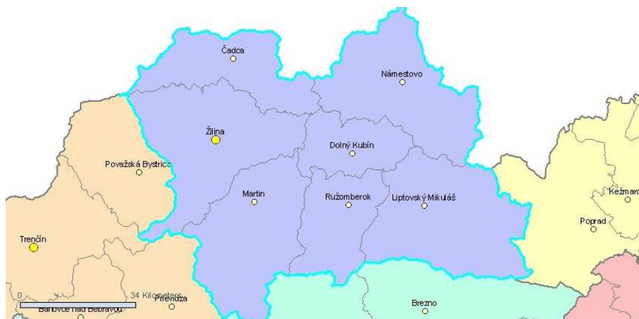
Obr. 1: Územné vymedzenie Žilinského kraja a sídel obvodných úradov.